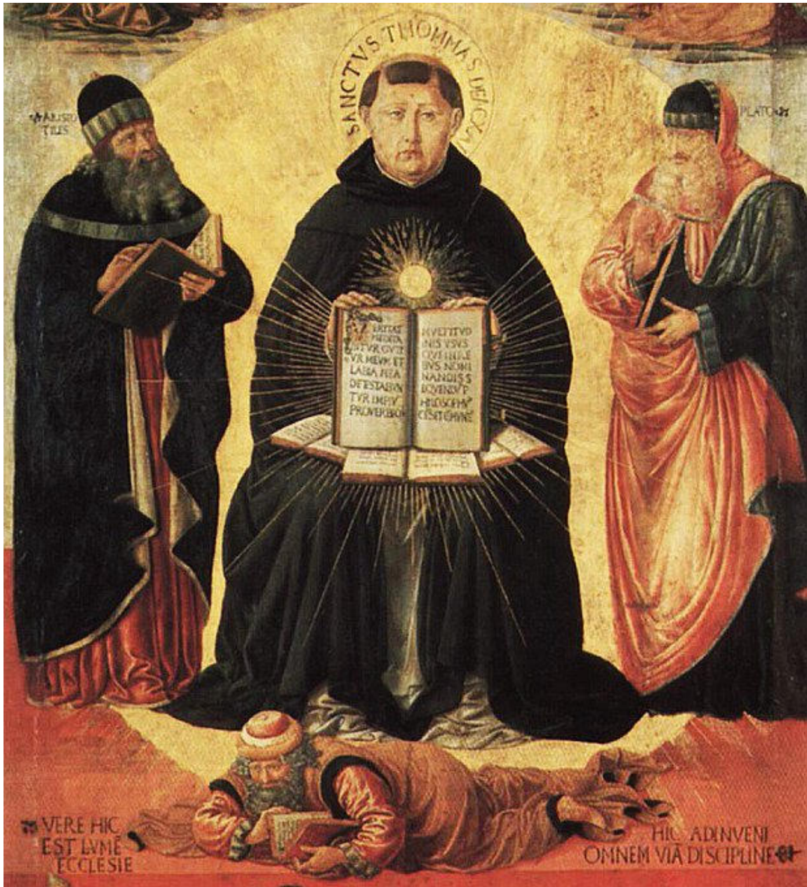
(Averroes a los pies, humillado por Santo Tomás. Detalle. Museo del Louvre)