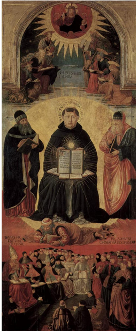
(Benozzo Gozzoli. Triunfo de Santo Tomás. Museo del Louvre. París)

También en el Museo del Louvre se expone un Triunfo de Santo Tomás realizado por Benozzo Gozzoli (1420 -1497).