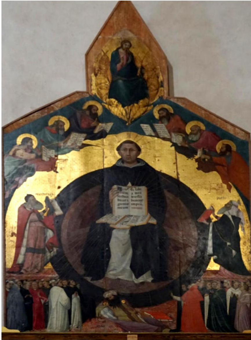
(Lippo Memmi. Triunfo de Santo Tomás . Iglesia de Santa Catalina . Pisa)

Mostremos algunas imágenes de la postración del sabio andalusí, empezando por la de Lippo Memmi (1291 - 1356), un sienés discípulo de Simone Martín, cuya pintura se encuentra en la iglesia de Santa Catalina en Pisa.