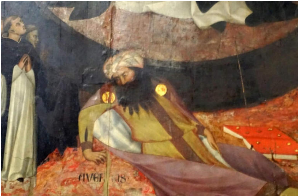
(Lippo Memmi. Triunfo de Santo Tomás . Detalle. Pisa)

Continuamos con el Triunfo pintado por Giovanni di Paolo (1399 – 1482) y que se encuentra en el Museo de Arte de San Luis.