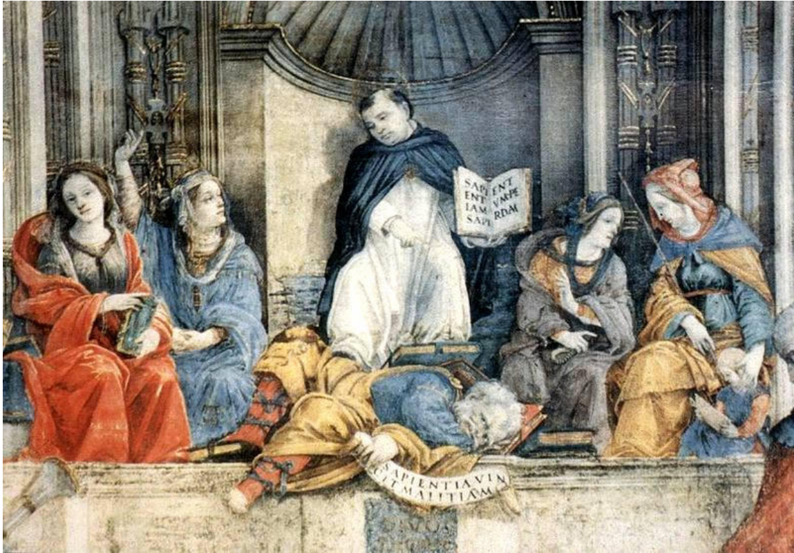
(Filippino Lippi. Triunfo de Santo Tomás . Detalle. S. M. sopra Minerva. Roma)

Terminamos los triunfos con su más bella representación: la realizada por Filippino Lippi (1457 - 1504) para la Capilla Carafa de Santa Maria sopra Minerva en Roma. Ya no hay turbante, solo alguien con cara de loco. Lippi ya no parece representar a Averroes.