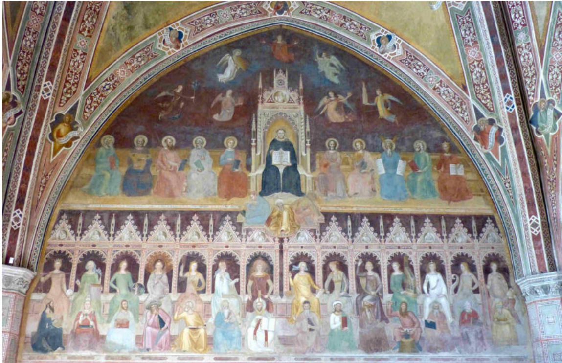
(Andrea de Bonaiuto. Triunfo de Santo Tomás . Santa Maria Novella. Florencia)

La representación más espectacular se la debemos Andrea de Bonaiuto (1319 – 1377) en la Capilla de los Españoles de Santa Maria Novella de Florencia. El nombre se debe al lugar donde asistían a misa los españoles destacados en la ciudad. El fresco muestra una de las imágenes más destacables de las Artes Liberales y sus sabios. Paradójicamente el humillado era mejor conocedor de ellas que los “triunfadores”.