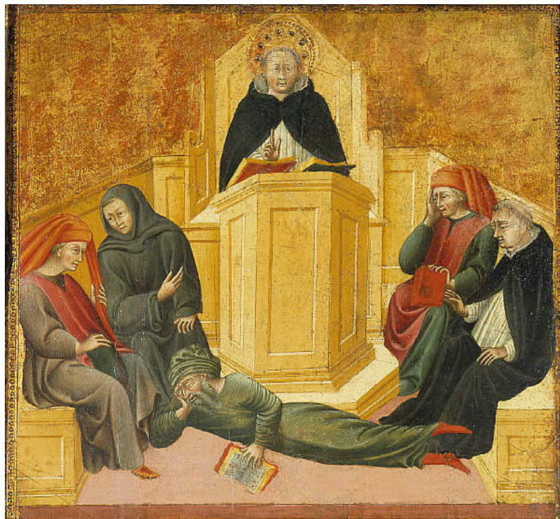
(Giovanni di Paolo . Triunfo de Santo Tomás . Museo de Arte. San Luis)

Continuamos con el Triunfo pintado por Giovanni di Paolo (1399 – 1482) y que se encuentra en el Museo de Arte de San Luis.