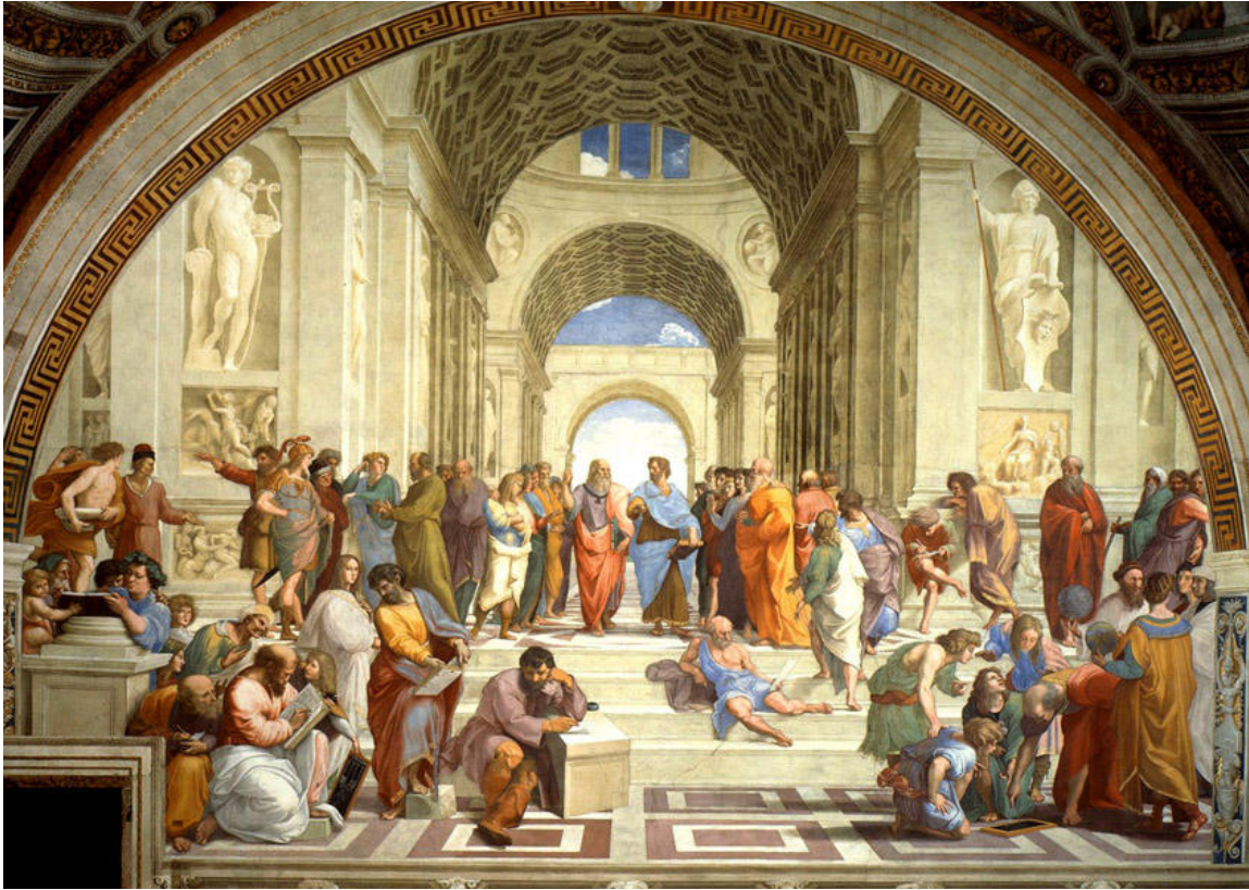
(Rafael. Escuela de Atenas . Ciudad del Vaticano)