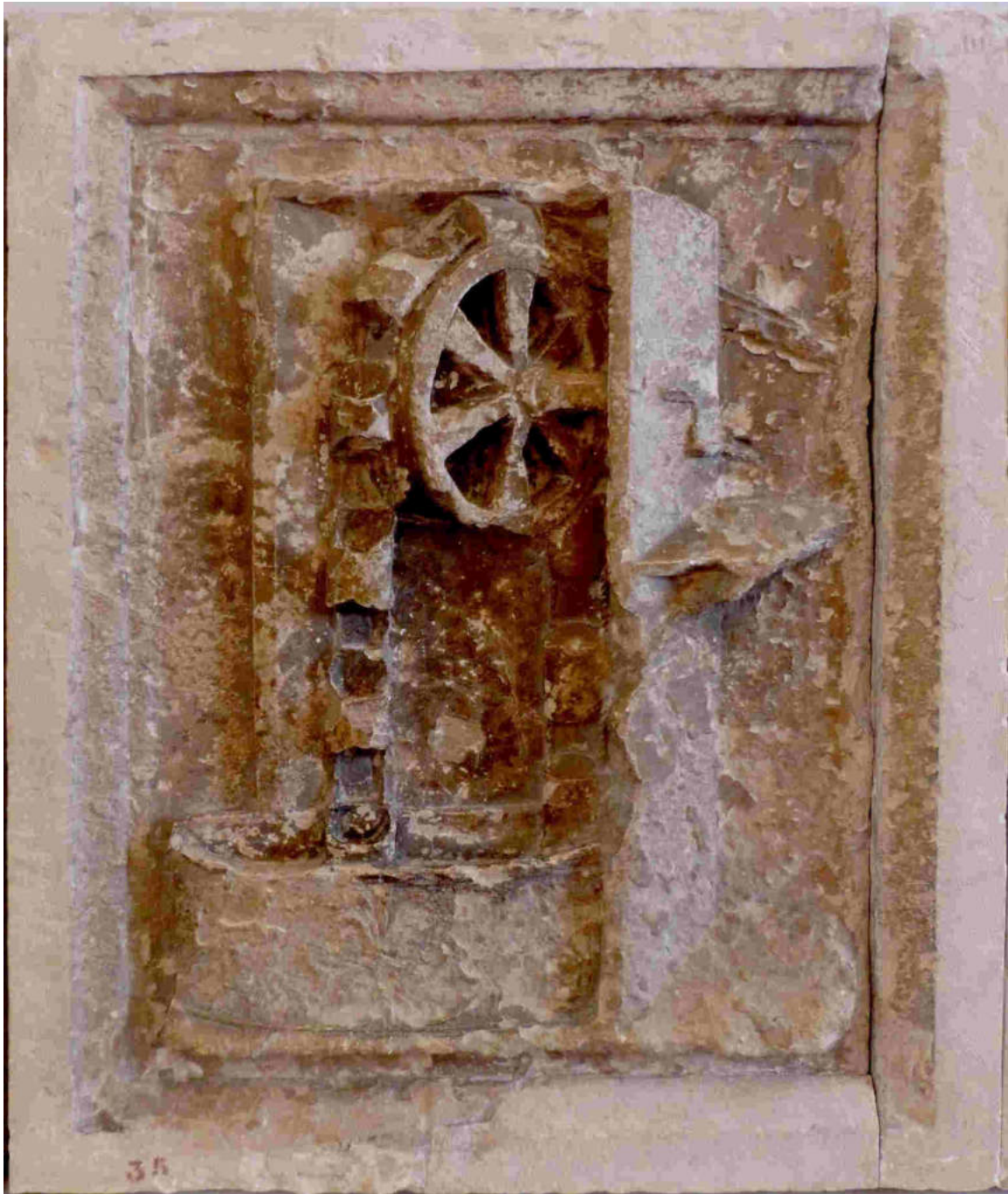
(Noria. Palacio ducal de Urbino)