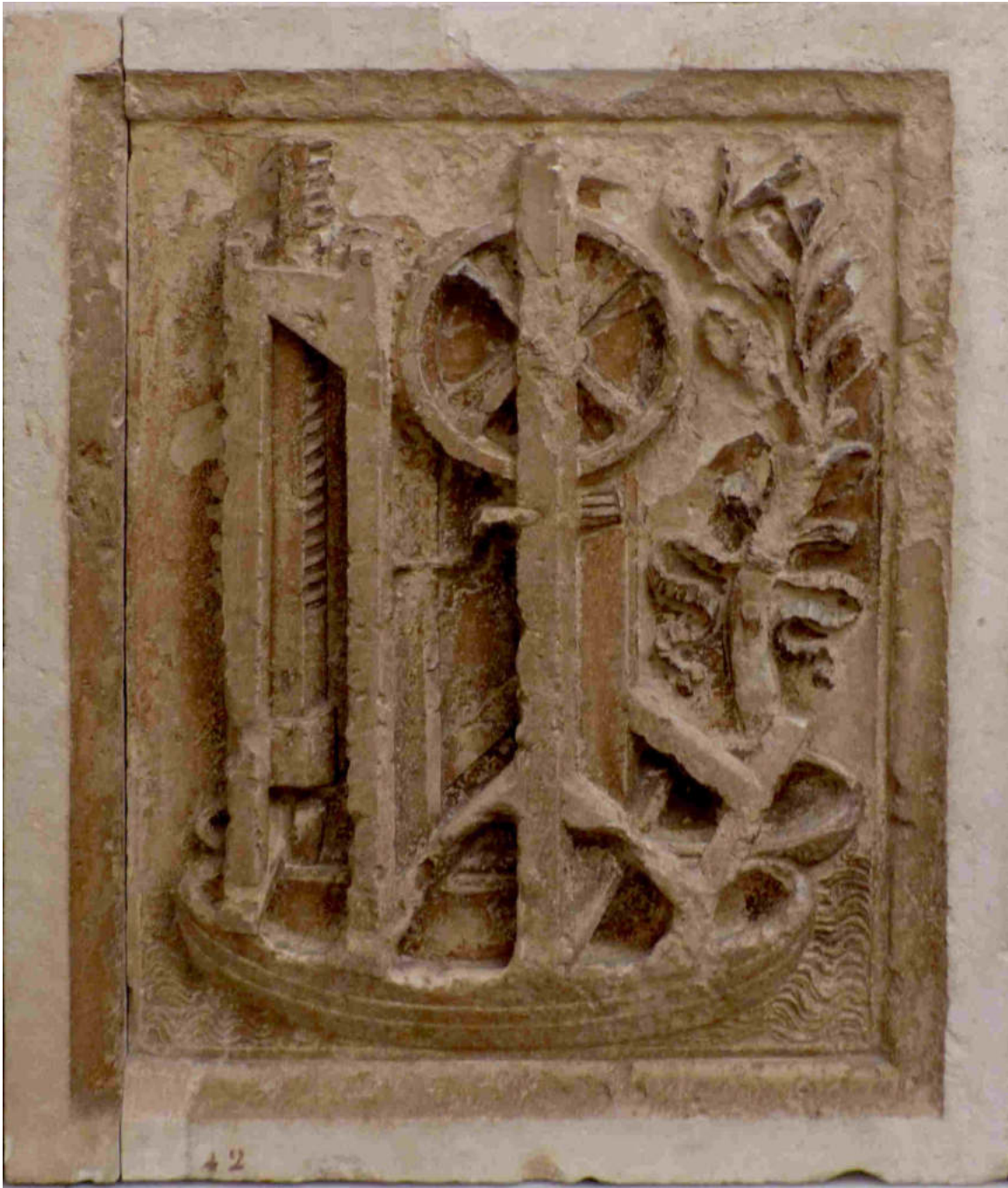
(Máquina elevadora. Palacio ducal de Urbino)