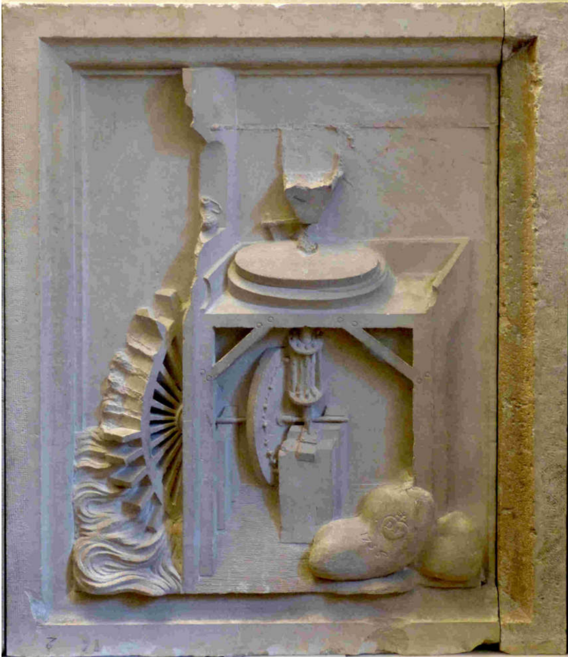
(Molino harinero. Palacio ducal de Urbino)