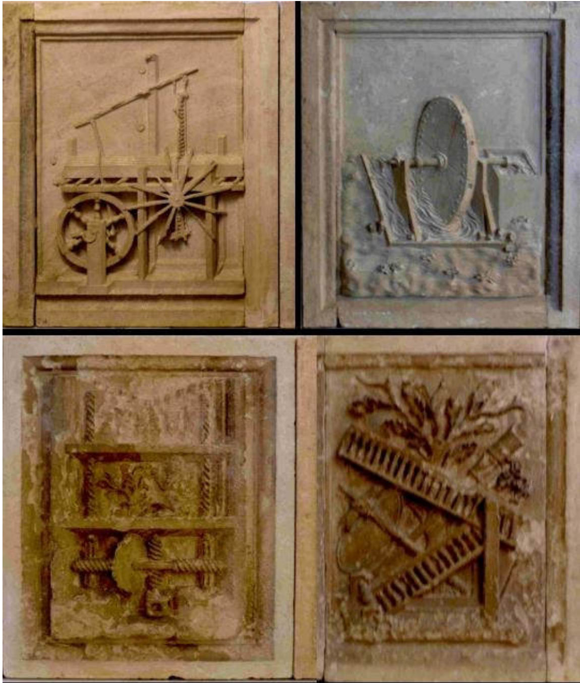
(Máquinas diversas. Palacio ducal de Urbino)