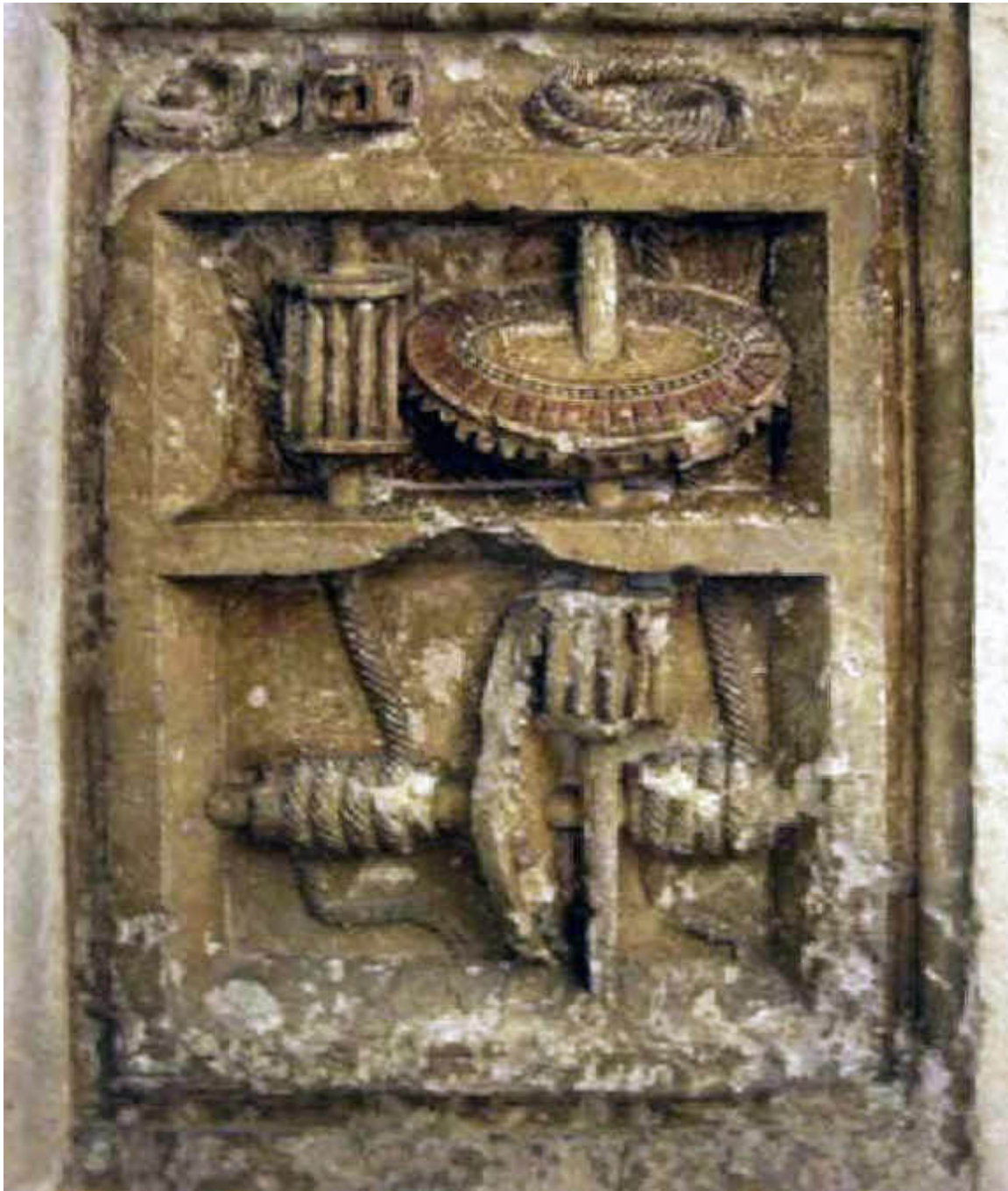
(Engranaje de transmisión. Palacio ducal de Urbino)