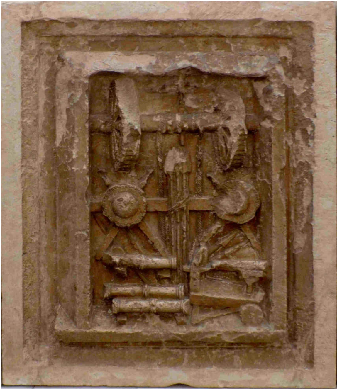
(Máquina perforadora. Palacio ducal de Urbino)