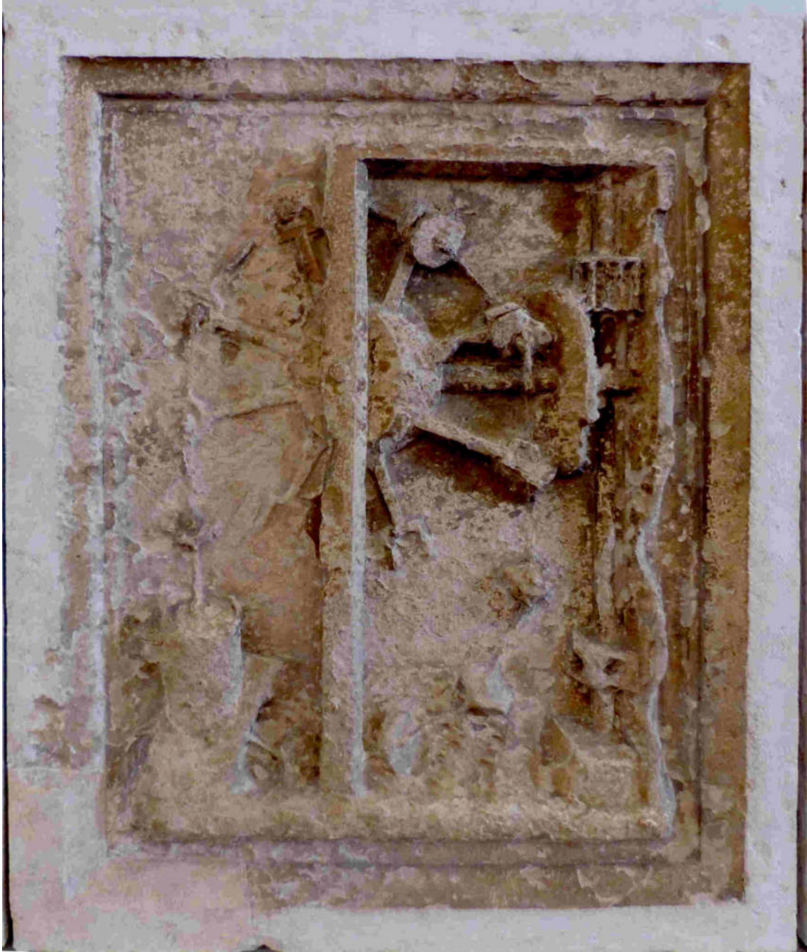
(Rueda. Palacio ducal de Urbino)