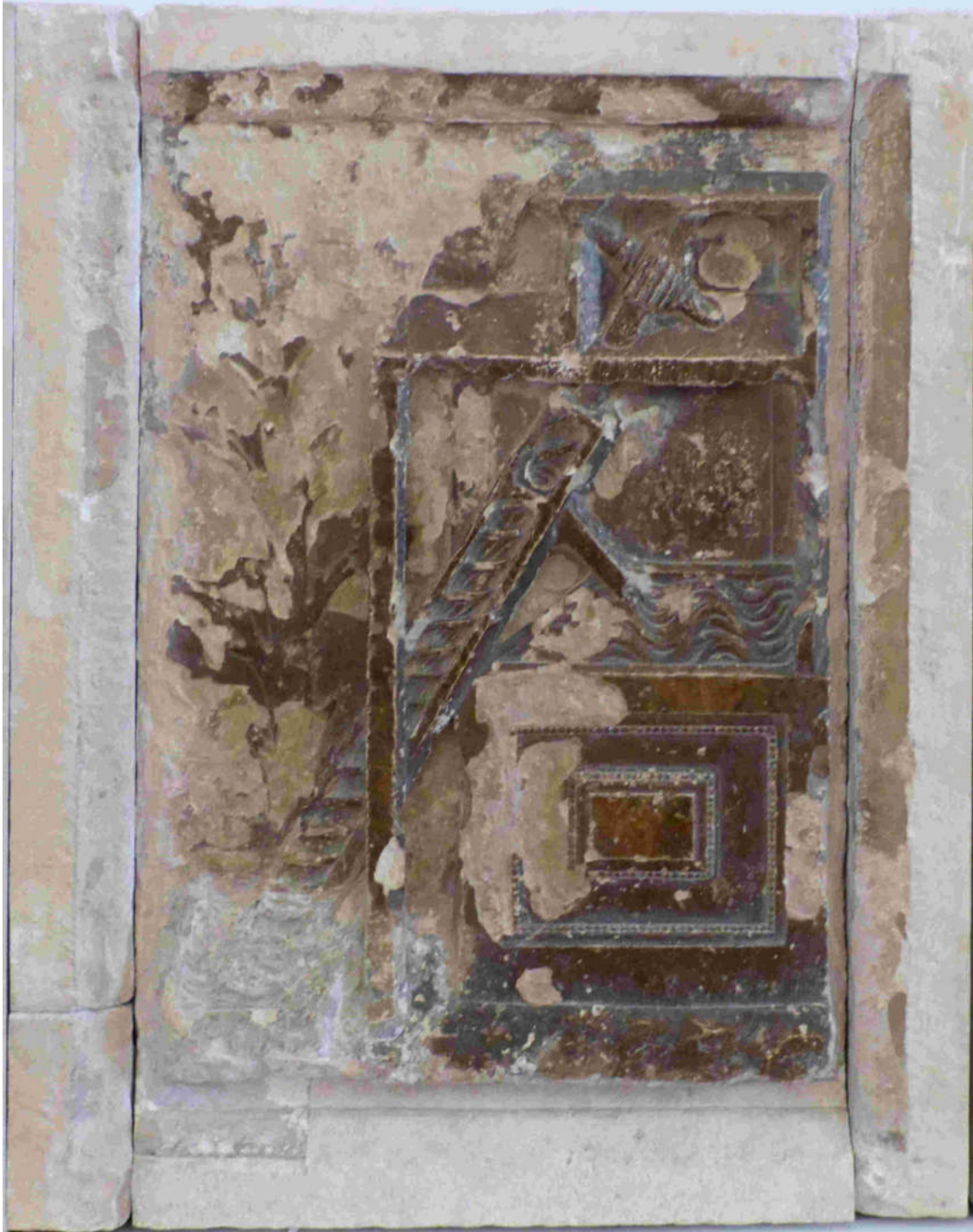
(Tornillo de Arquímedes. Palacio ducal de Urbino)